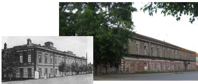
Здание Вятского реального училища, в котором в 1874- 1875 гг. учился рабочий- революционер Халтурин С.Н. (ул. Спасская, д. 67)