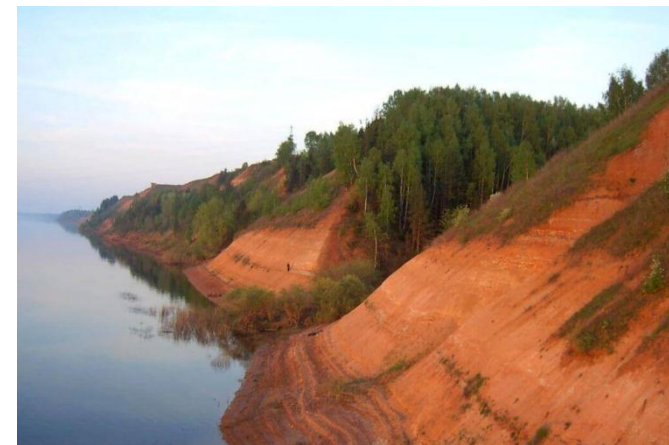
Котельничское местонахождение парейазавров

🏛 достопримечательные места – творения, созданные человеком, или совместные творения человека и природы, в том числе места традиционного бытования народных художественных промыслов; центры исторических поселений или фрагменты градостроительной планировки и застройки; памятные места, культурные и природные ландшафты, связанные с историей формирования народов и иных этнических общностей на территории РФ, историческими (в том числе военными) событиями, жизнью выдающихся исторических личностей; объекты археологического наследия; места совершения религиозных обрядов; места захоронений жертв массовых репрессий; религиозно-исторические места.