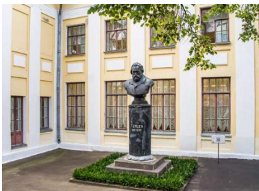
Памятник А.И. Герцену (ул. Герцена, д. 50)